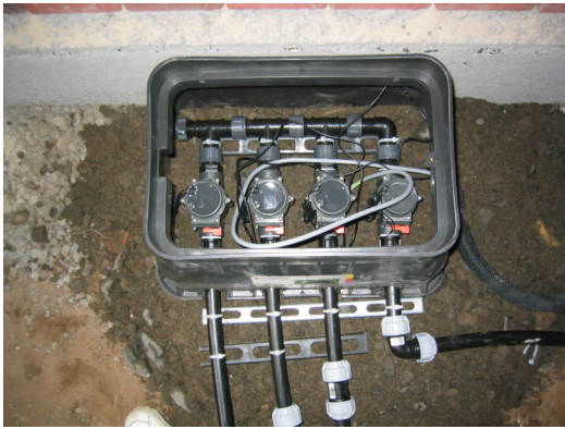
Verteileranlage für 4 Magnetventile

...reduziert den Gießaufwand um 99% und somit auch die Unterhaltskosten.