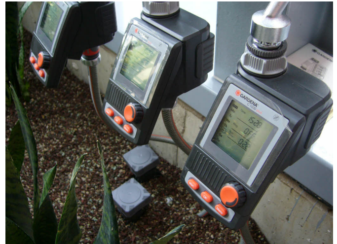
Einzelventile für 3 Parzellen mit Druckminderer