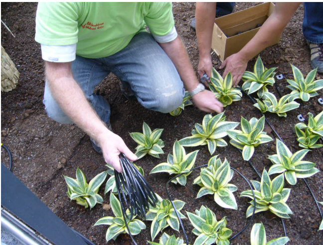
Montagearbeiten Tropfrohr 4,6 mm mit 1,5 l/h