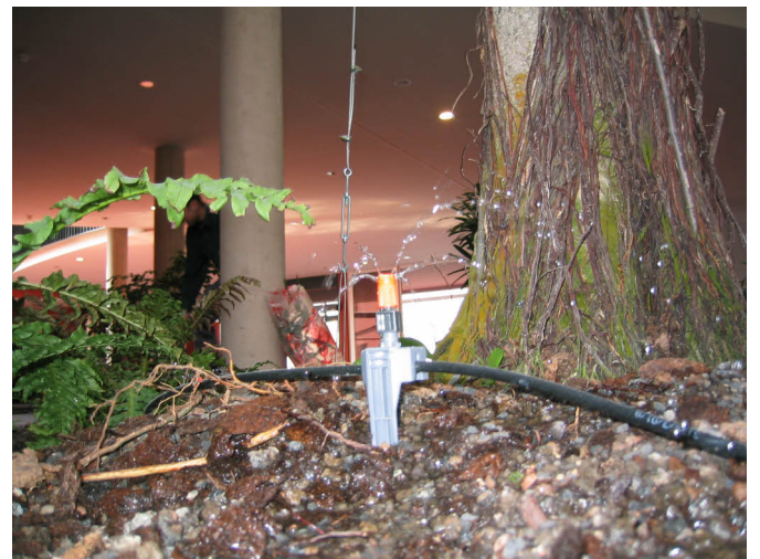
Kleinflächendüse im Arbeitseinsatz