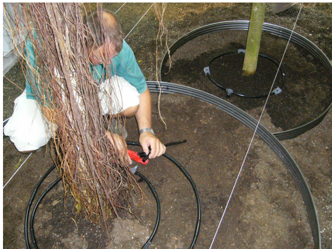
Montage Tropfrohr 4 l/h als Tropfring um Solitärbaum