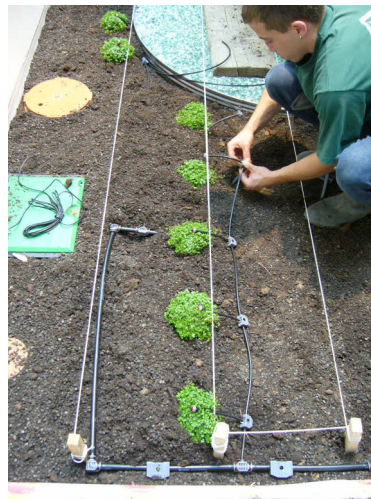
Montage Einzeltropfer 2 l/h für Bodendecker