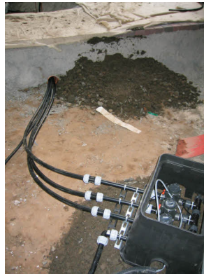
Vormontage der Hauptleitungen und Verteilung in den einzelnen Parzellen