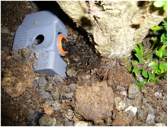
2 l/h Reihentropfer im Einsatz