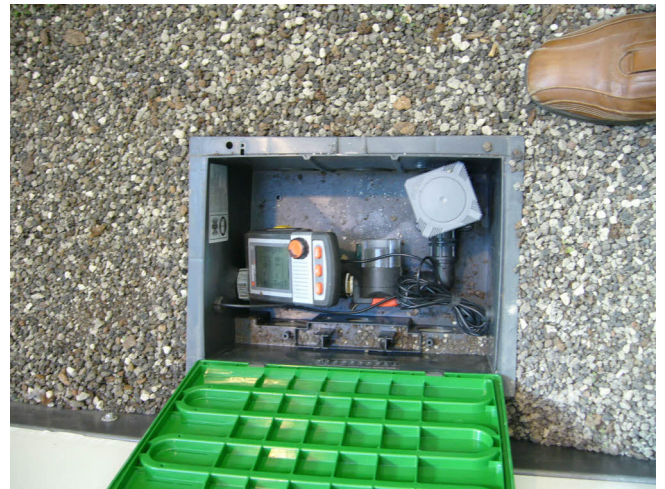
Ventilbox mit Einzelventil und Feinfilter