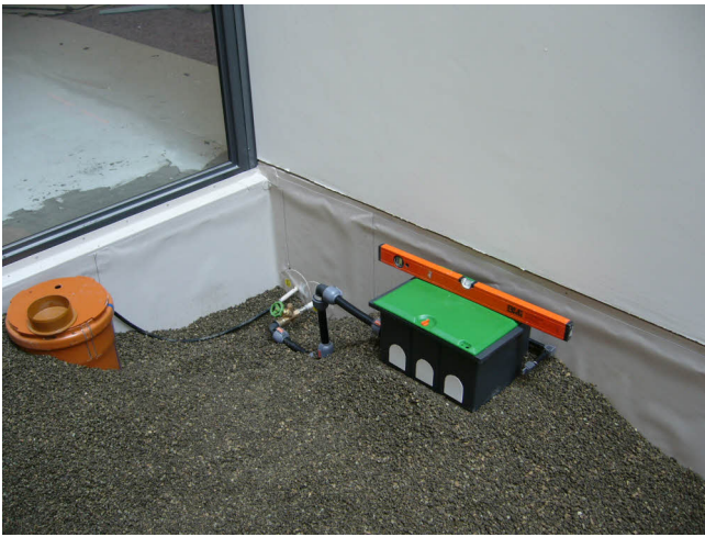
Vormontage Druckleitung mit Absperrschieber