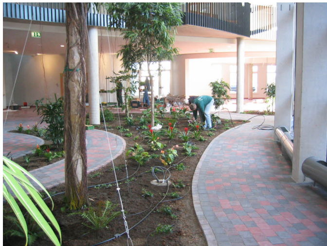
Montagearbeiten der einzelnen Bewässerungsprodukte