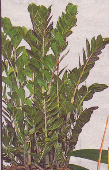
Die Zamiaulcas zamiifolia stammt aus Ostafrika, hat noch keinen deutschen Namen. Die Blätter erinnern an Wildfarne