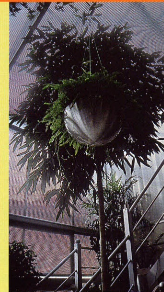
Die Nephrolepis-Ampel im Edelstahlgefäß lässt sich mit einer Winde zum Gießen auf die Galerie ziehen