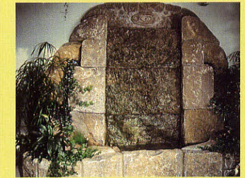
Der Wandbrunnen sorgt für ein angenehmes Klima im Wintergarten