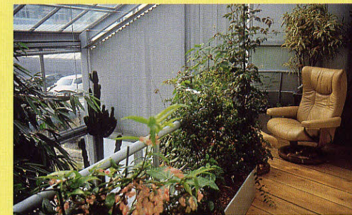
Der Wintergarten ist an ein bestehendes Wohn- und Geschäftshaus angebaut und liegt mitten in der Stadt